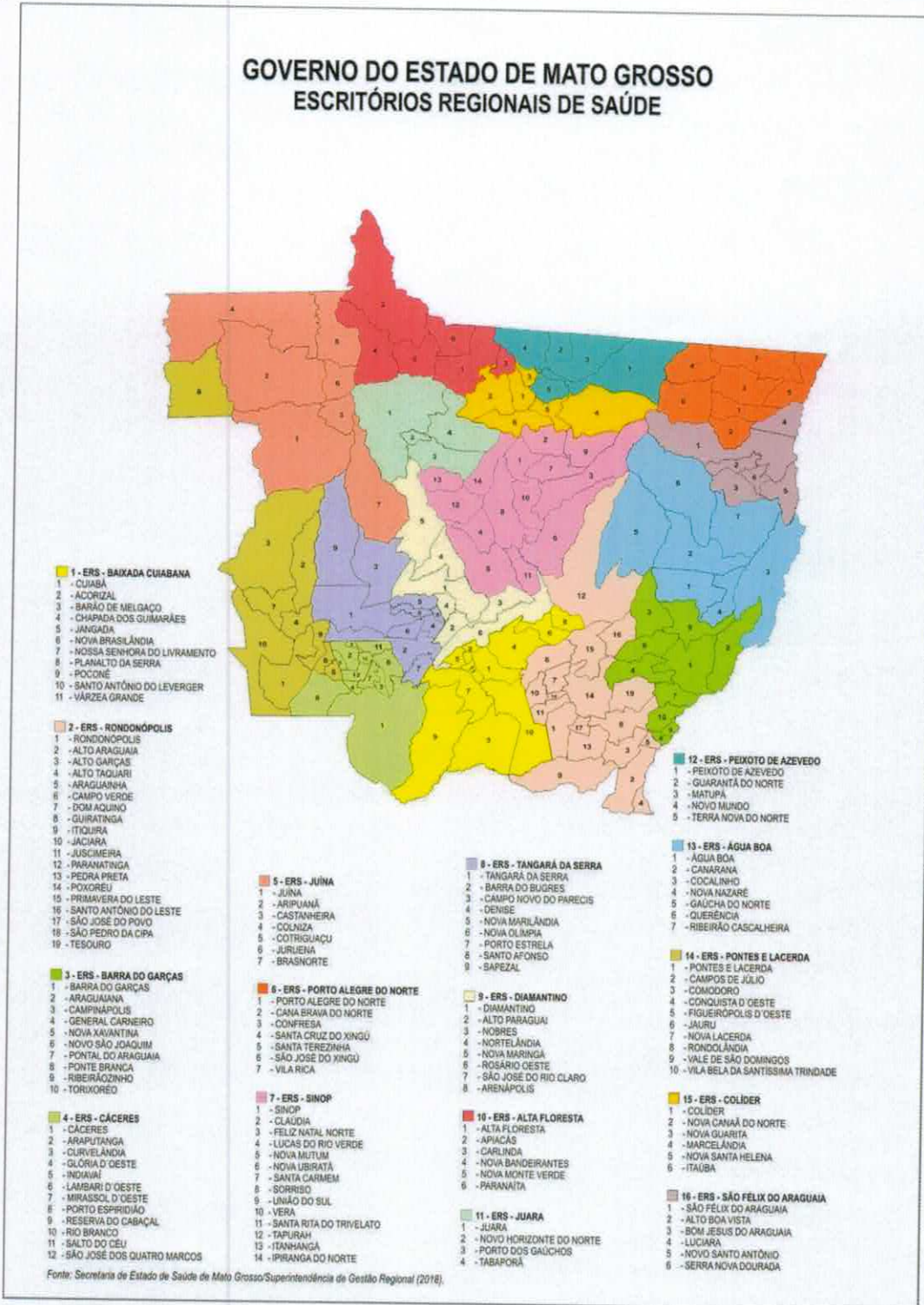
FIGURA 2 – Mapa demonstrativo dos Municípios que constituem as micro regiões de Saúde. SES, 2018.