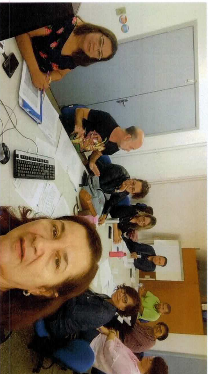
Planejamento das Oficinas Estadual e Regional