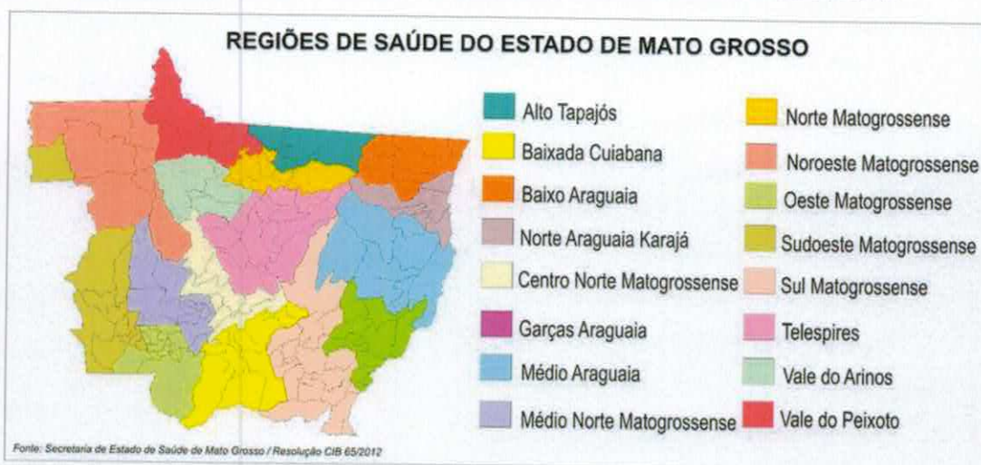
FIGURA 1 - Mapa demonstrativo das regiões de Saúde de Mato Grosso. SES, 2012.

Os municípios pertencentes aos ERS (Figura 2) estão organizados e agrupados em Regiões sendo estruturadas em micro e macros regiões em que contam o aporte para cada região de gestão regionalizada da saúde, como unidade gestora local da Secretaria de Estado de Saúde, esta é uma medida estratégica de desconcentração e descentralização administrativa e técnica para atender as Secretarias Municipais em face a grande extensão territorial do Estado e as inúmeras e distintas demandas de saúde.