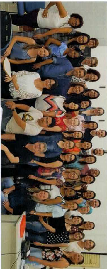
Micro Região Sinop