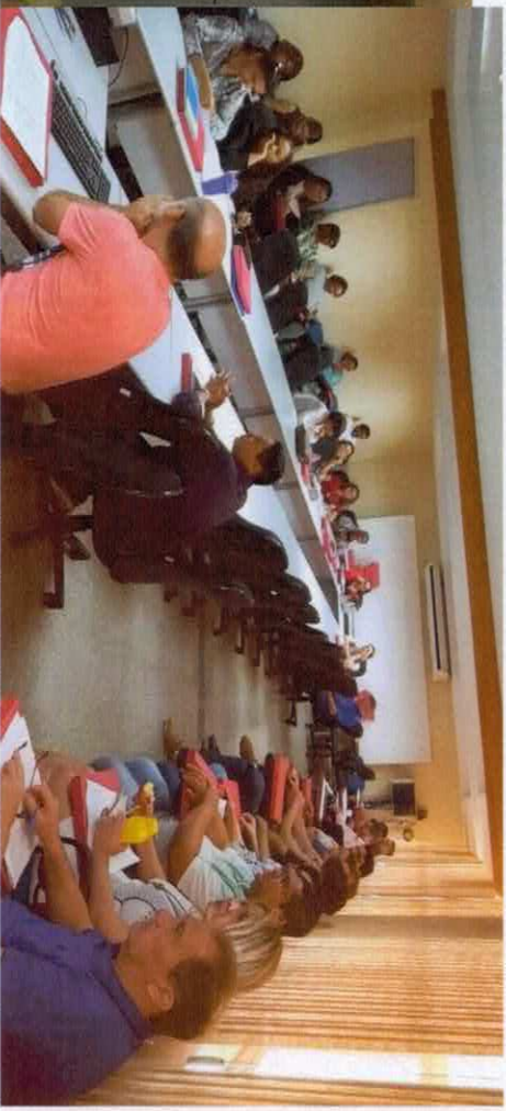
PLENÁRIA DA OFICINA REALIZADA EM AGOSTO 2018